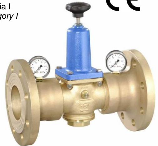
DN 65 - DN 80

(Versione DN 65 & 80 con manometri a connessione separata / version DN 65 & 80 with separate manometer connections)