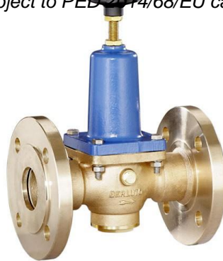
DN 40 - DN 50